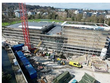
Neubau Hallenbad Frauenfeld

Weitere Informationen unter: www.bhateam.ch