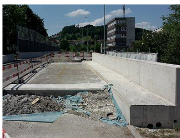
Erweiterung Murgbrücke Spange Hofen